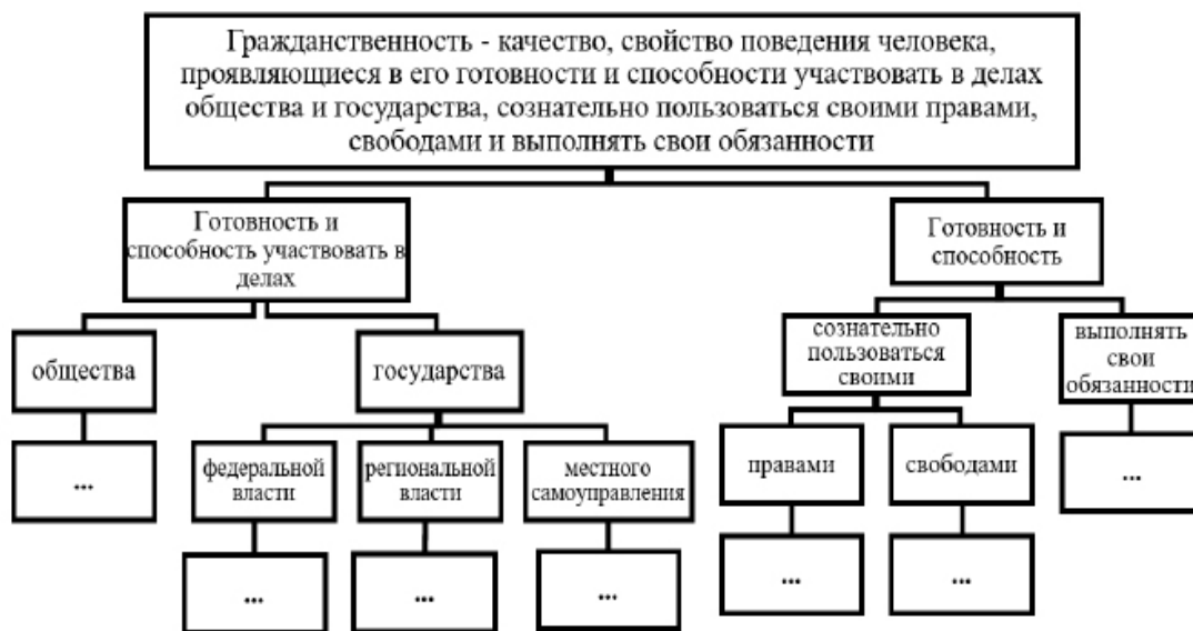
Рисунок 2. Блок-схема понятия «гражданственность»

В итоге для разработки механизмов воспитания гражданственности Центр принял решение взять из Политического словаря 22 определение понятия «гражданственность», которым давно пользовался в своих разработках. На основе этого определения была построена следующая блок – схема (рис.2).